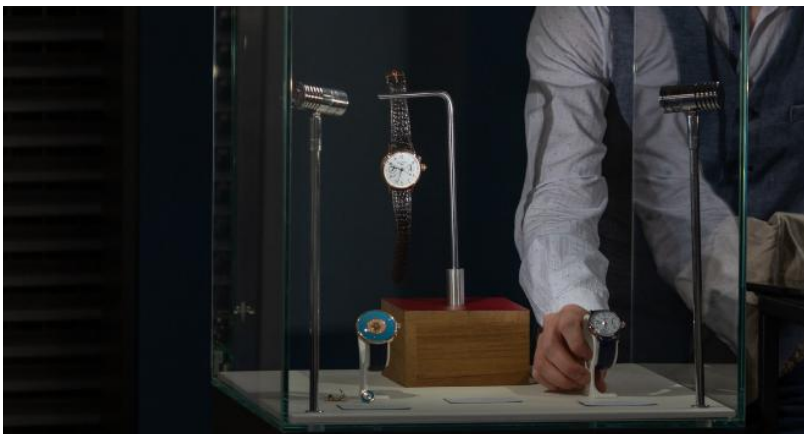
VO'Clock Il salone dedicato agli orologi di altissima qualità segna il ritorno nella Fiera vicentina di un comparto molto seguito da appassionati e collezionisti

Il settore orafa svela numeri e previsioni. Dalle 13 alle 14 sul palco principale di VicenzaOro il Club degli Orafi e Intesa San Paolo sveleranno i numeri del comparto, ma anche le sensazioni degli imprenditori sul presente e sul prossimo futuro del settore. L'incontro sarà preceduto, alle 10.30, dal dibattito sull'economia circolare nel settore orafa organizzata da Trenddivision Jewellery + Forecasting, l'osservatorio indipendente sulle tendenze di Italian exhibition group. Dalle 14.30 alle 16.30 Gem Talk dell'Istituto gemmologico italiano sulla Tormalina e dalle 18 alla Buyers Lounge focus sul mercato statunitense. A VO'Clock Privé alle 11 ci sarà l'incontro sulle ultime innovazioni dell'orologeria, mentre alle 15.30 Locman e Oisa 1937 presenteranno il movimento meccanico made in Italy. M.E.B.