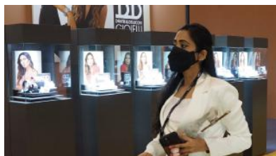
Il salone La boutique di VicenzaOro è aperta fino al 21 marzo